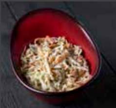
Coleslaw 840 CAL SR 6