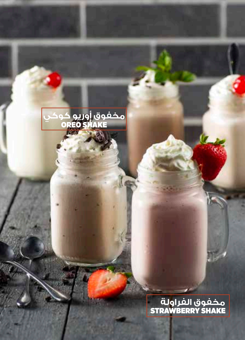
مخفوق أوريو كوكي OREO SHAKE