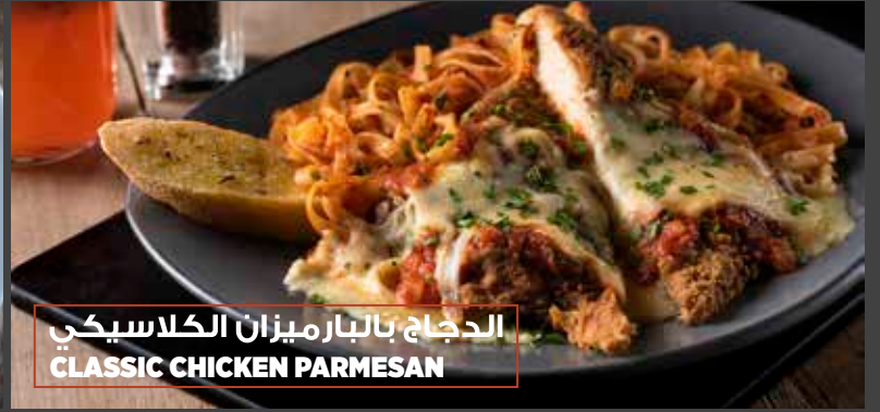
الدجاج بالبارميزان الكلاسيكي CLASSIC CHICKEN PARMESAN