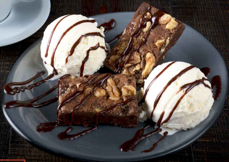
بلو ريبون براونني BLUE RIBBON BROWNIE