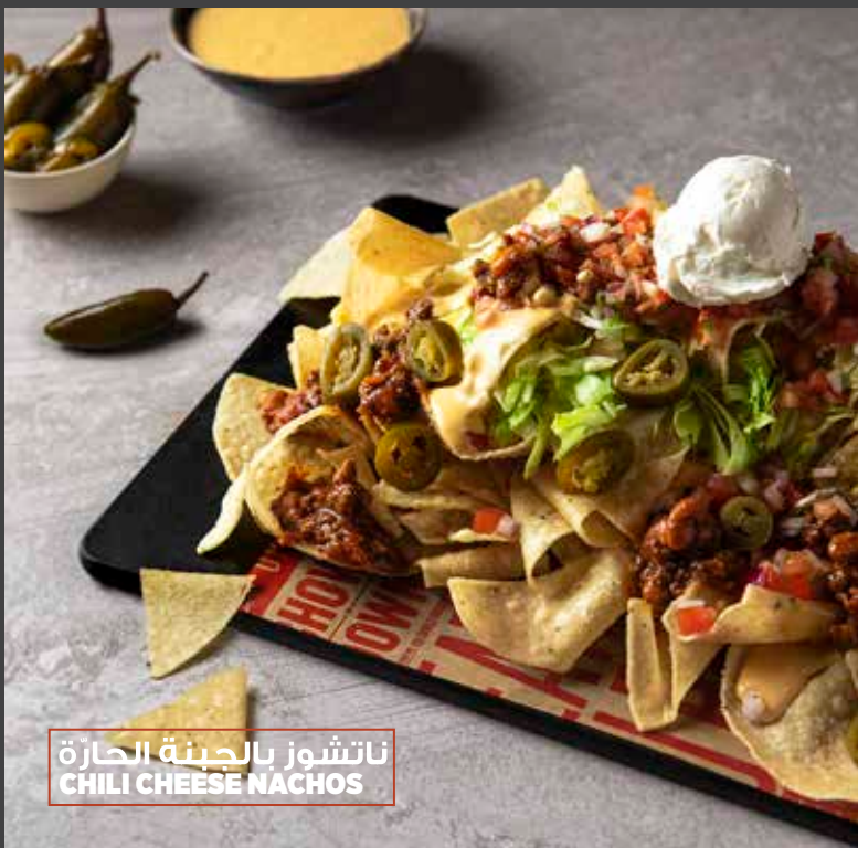
ناتشوز بالجبن الحارة CHILI CHEESE NACHOS