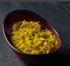
Pilaf Rice 326 CAL SR 6