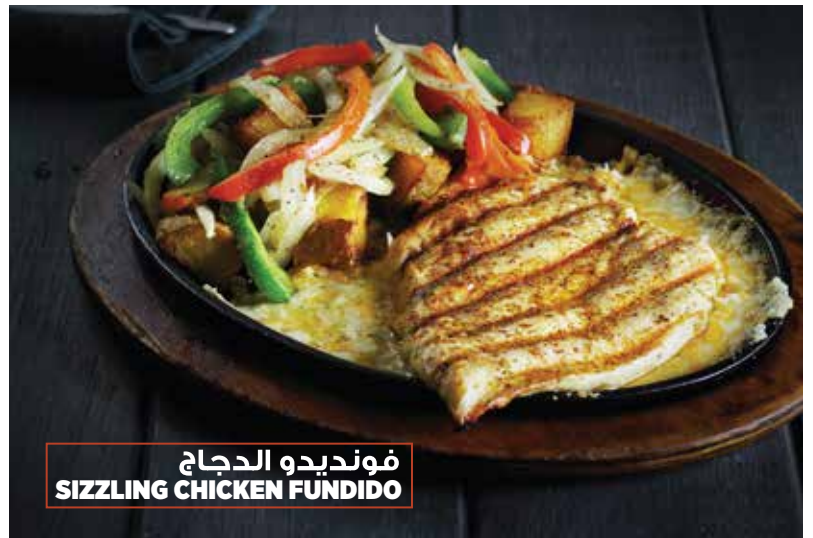
فونديدو الدجاج SIZZLING CHICKEN FUNDIDO