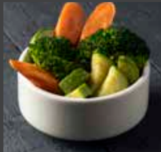
Vegetables 89 CAL SR 9

روبيان مع جينة البارميزان ١٥٢ سعرة ٢٣ ريال