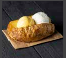
Baked Potato 345 CAL SR 13