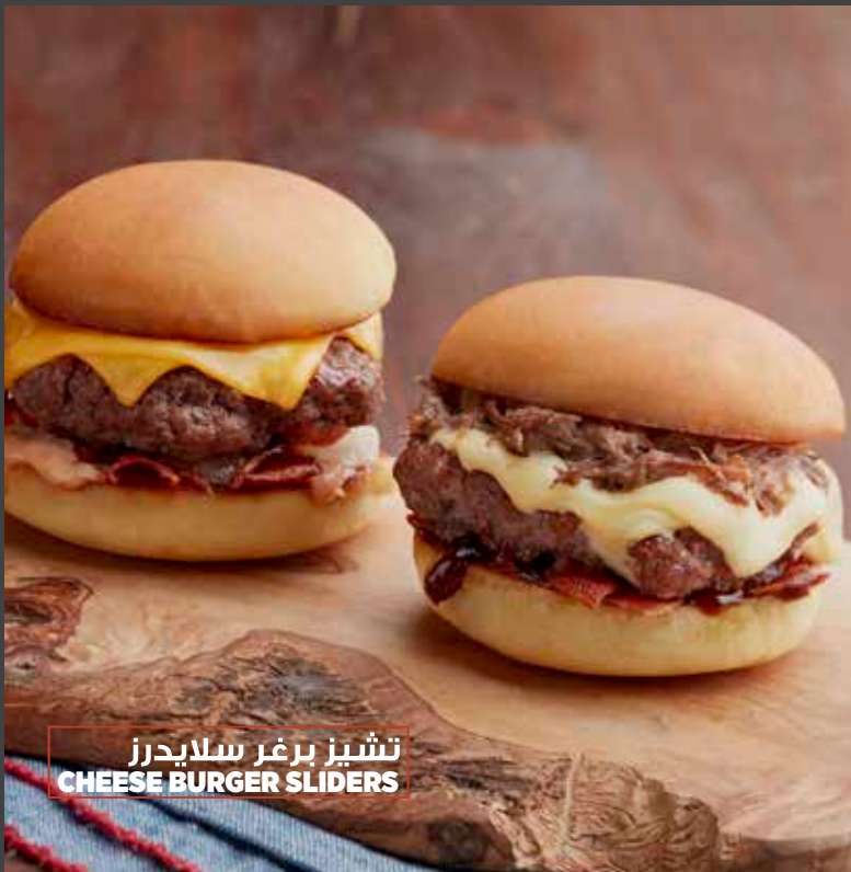
تشيز برجر سلايدرز CHEESE BURGER SLIDERS

Served in lunch portion size. This offer only applies to a select list of items. Please ask your waiter for further details. Not valid with any other offer or discount. Sunday to Thursday from 11am - 5pm