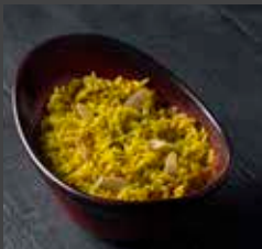
Pilaf Rice 326 CAL SR 6