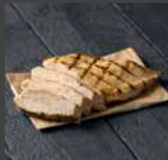
Chicken 321 CAL SR 16