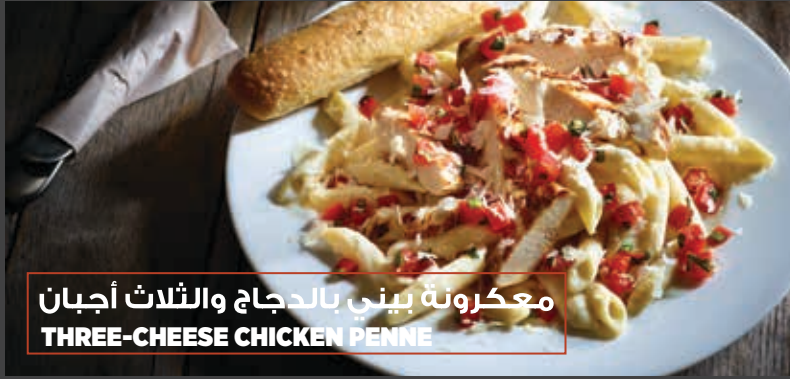
معكرونة بيني بالدجاج والثلاث أجبان THREE-CHEESE CHICKEN PENNE