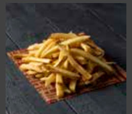
French Fries 420 CAL SR 11