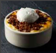
Loaded Mashed Potatoes 454 CAL SR 13