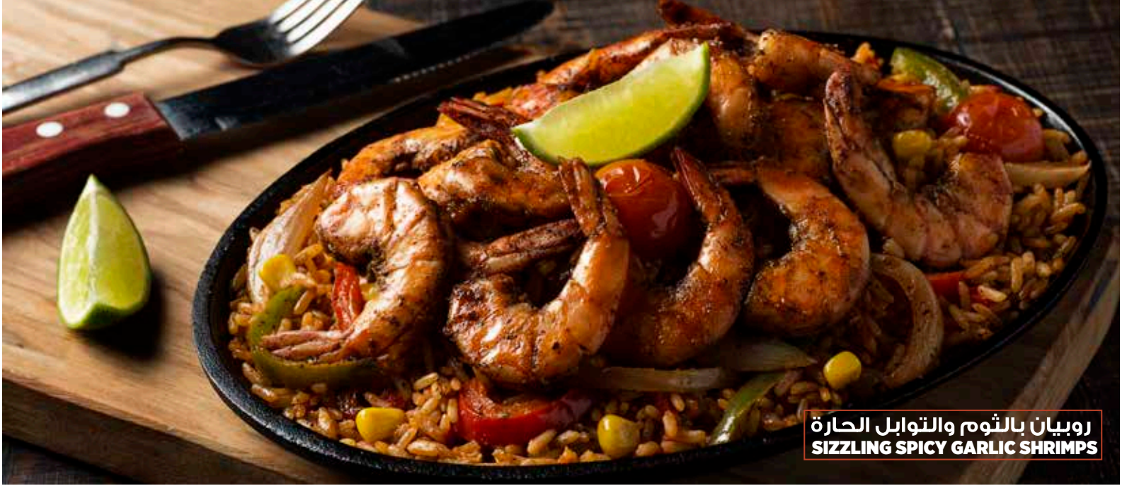
روبيان بالثوم والتوابل الحارة SIZZLING SPICY GARLIC SHRIMPS