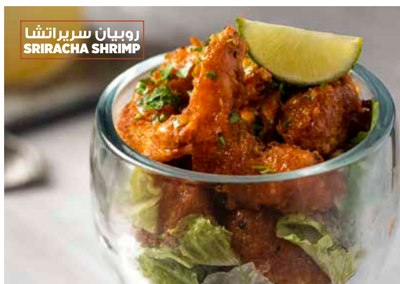
روبيان سريراتشا SRIRACHA SHRIMP

كيساديّا الدجاج، وأجنحة الدجاج بدون عظم ٢٣٧١ سعرة ٦٨ ريال