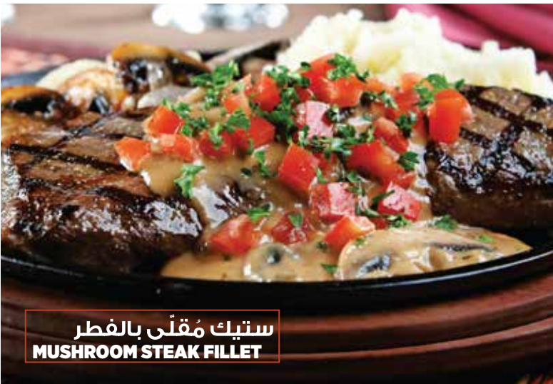
ستيك مُقلّي بالفطر MUSHROOM STEAK FILLET