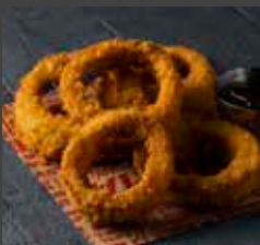
Onion Rings 771 CAL SR 11