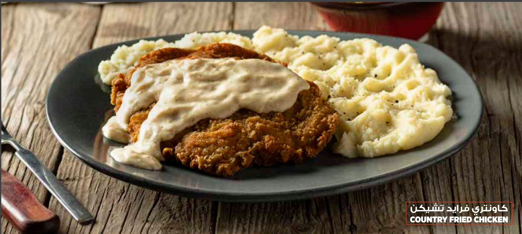
كاونترى فرايد تشيكن COUNTRY FRIED CHICKEN