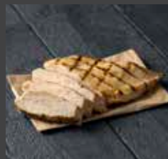
Chicken 321 CAL SR 16