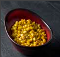
Corn 428 CAL SR 6