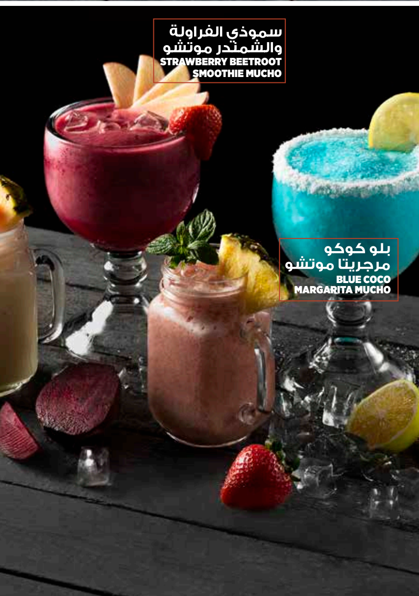
سموذي الفراولة والشمندر موتشو STRAWBERRY BEETROOT SMOOTHIE MUCHO