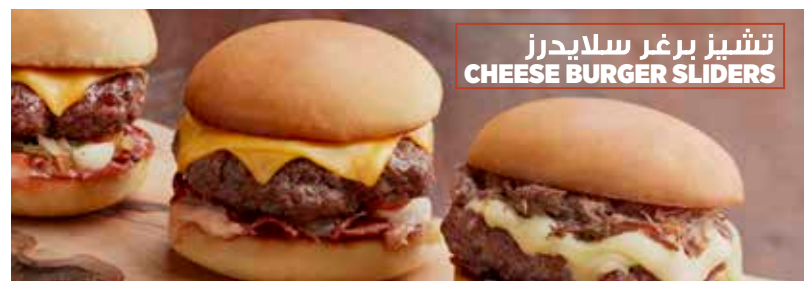
تشيز برغر سلايدرز CHEESE BURGER SLIDERS