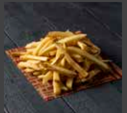
French Fries 420 CAL SR 11