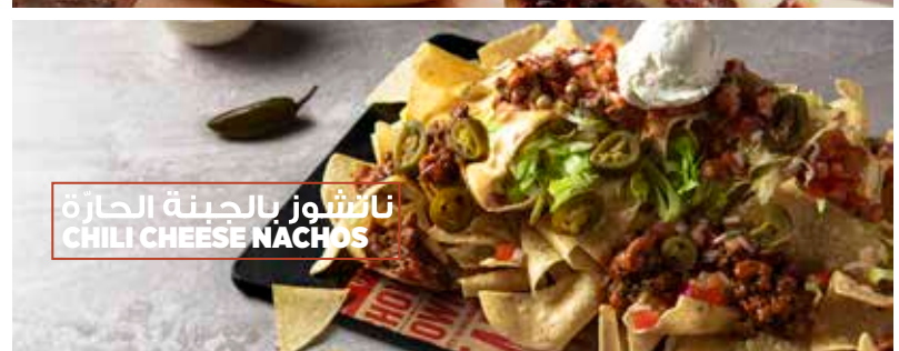
ناتشوز بالجبنة الحارة CHILI CHEESE NACHOS