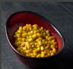
Corn 428 CAL SR 6