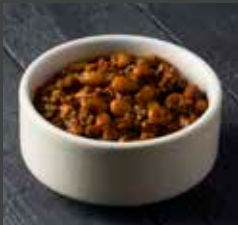
Homemade Chili Sauce 246 CAL SR 11