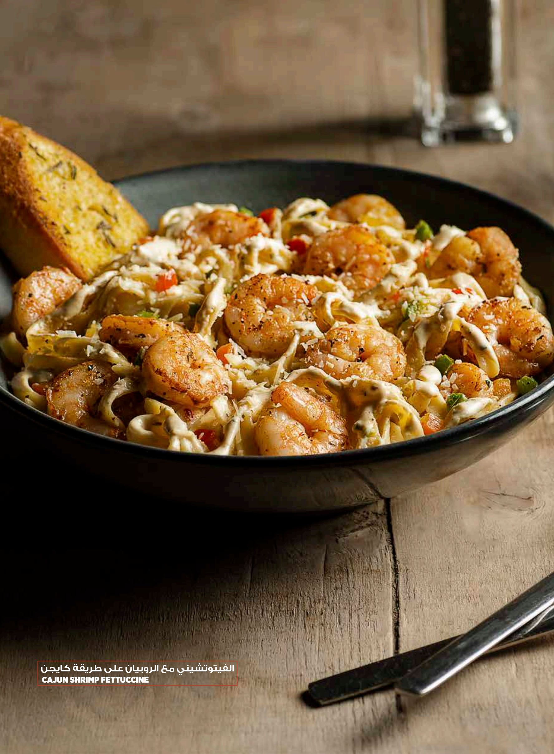
الفيتوتشيني مع الروبيان على طريقة كايجن CAJUN SHRIMP FETTUCCINE