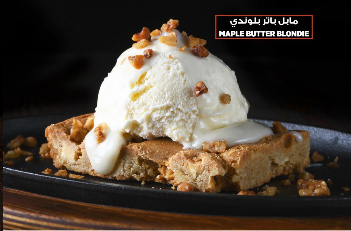
مابل باتر بلوندي MAPLE BUTTER BLONDIE