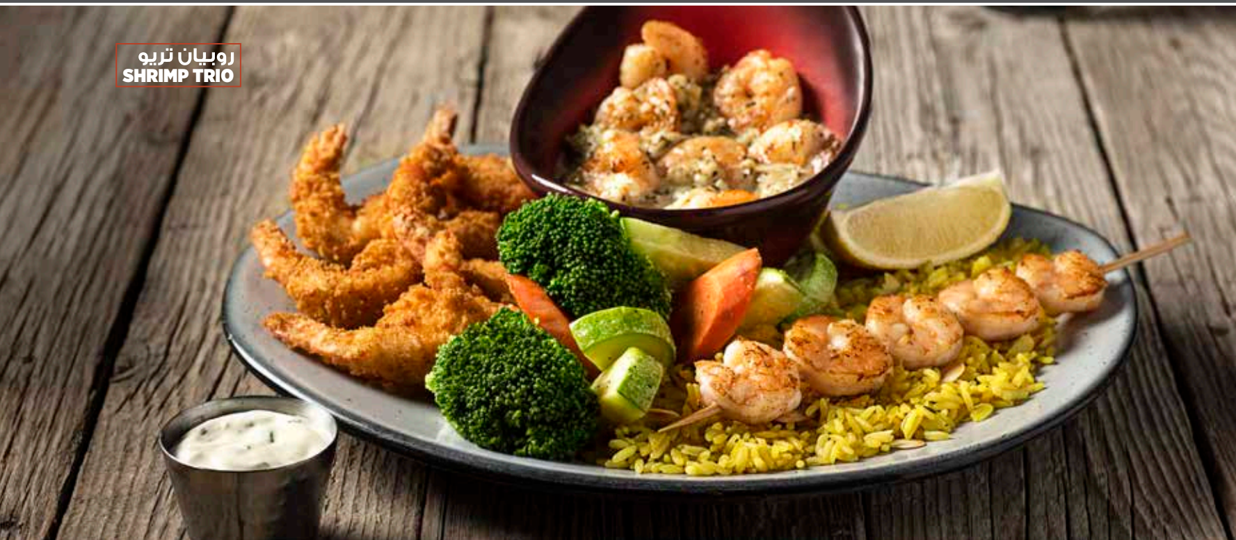
روبياں تريو SHRIMP TRIO

فيليه سلمون مشوي بصلصة التشيبوتلي مع صلصة الفطر، يُقدّم مع أرز بريمافيرا وتوابل الليمون الحامضة الحارة ١١٠٨ سعرة ٧٢ ريال