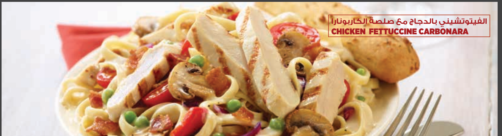
الفيتوتشيني بالدجاج مع صلصة الكاربونارا CHICKEN FETTUCCINE CARBONARA