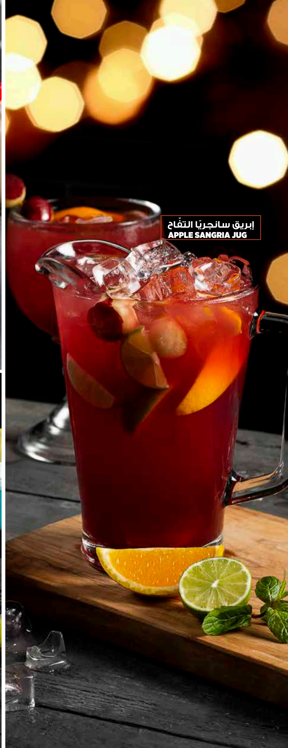
إبريق سانجريا التفاح APPLE SANGRIA JUG