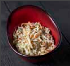
Coleslaw 840 CAL SR 6