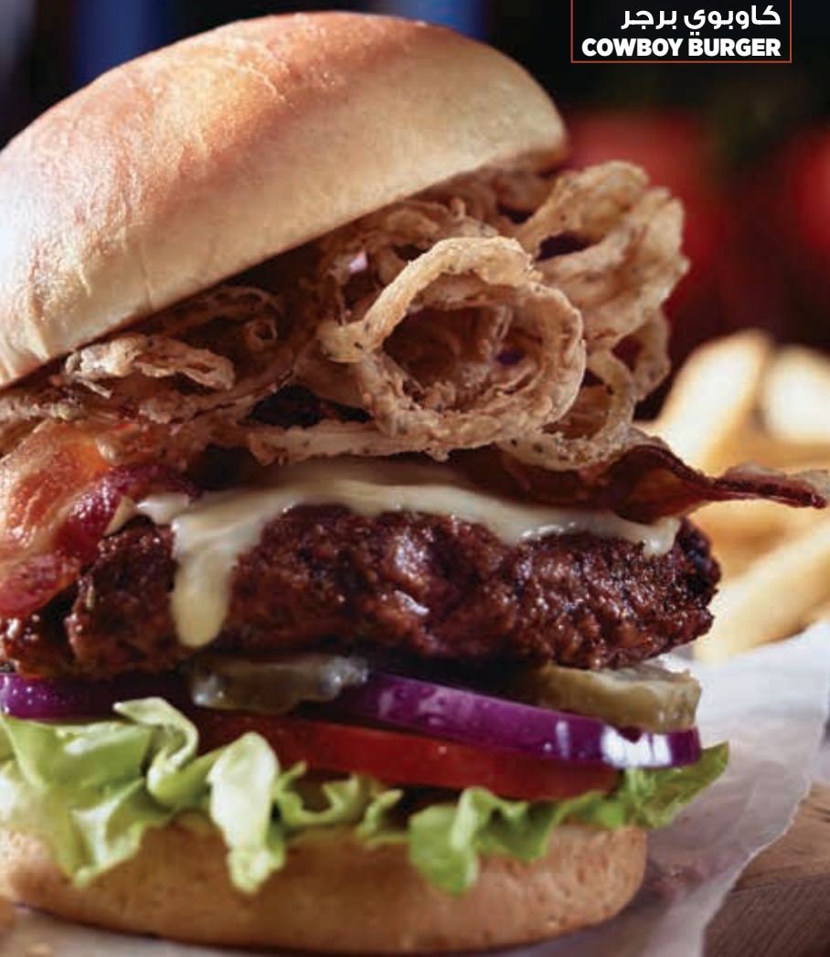
كاوبوي برجر COWBOY BURGER