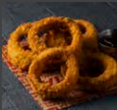
Onion Rings 771 CAL SR 11