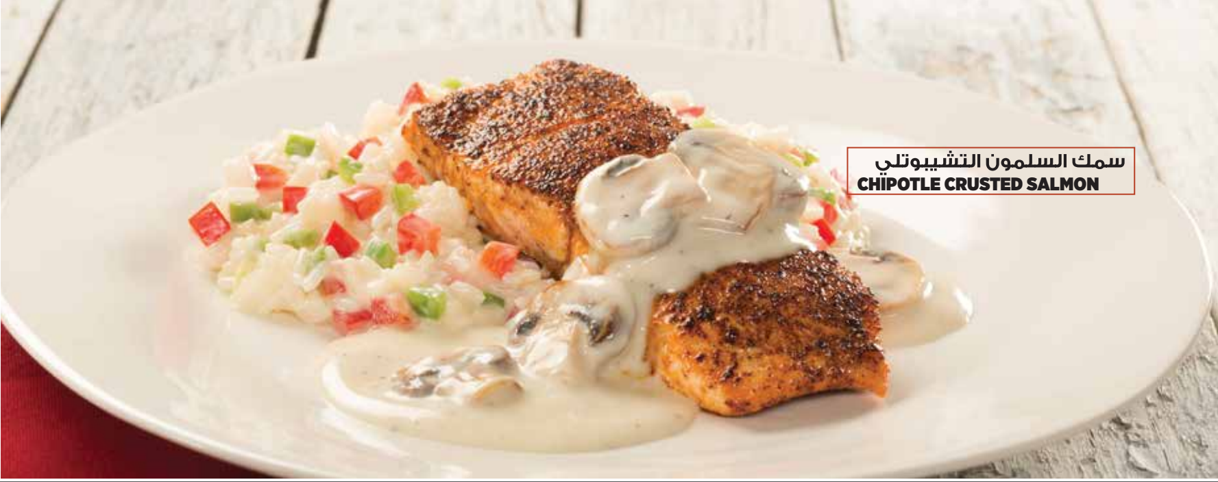
سمك السلمون التشيبوتلي CHIPOTLE CRUSTED SALMON