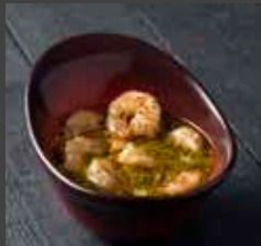
Shrimps N' Parmesan 152 CAL SR 23

روبيان مع جبنّة البارميزان ١٥٢ سعرة ٢٣ ريال