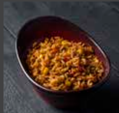
Mexican Rice 269 CAL SR 6